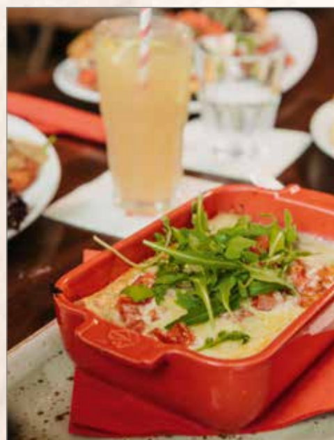
Dieses Gericht arbeitet 24/7 im Schichtdienst.

Lasagne al forno original italienische Nudeln mit marinierten Tomatenwürfeln und herzhafter Bolognese-Sauce aus Rinderhackfleisch, gratiniert mit Käse € 12,45