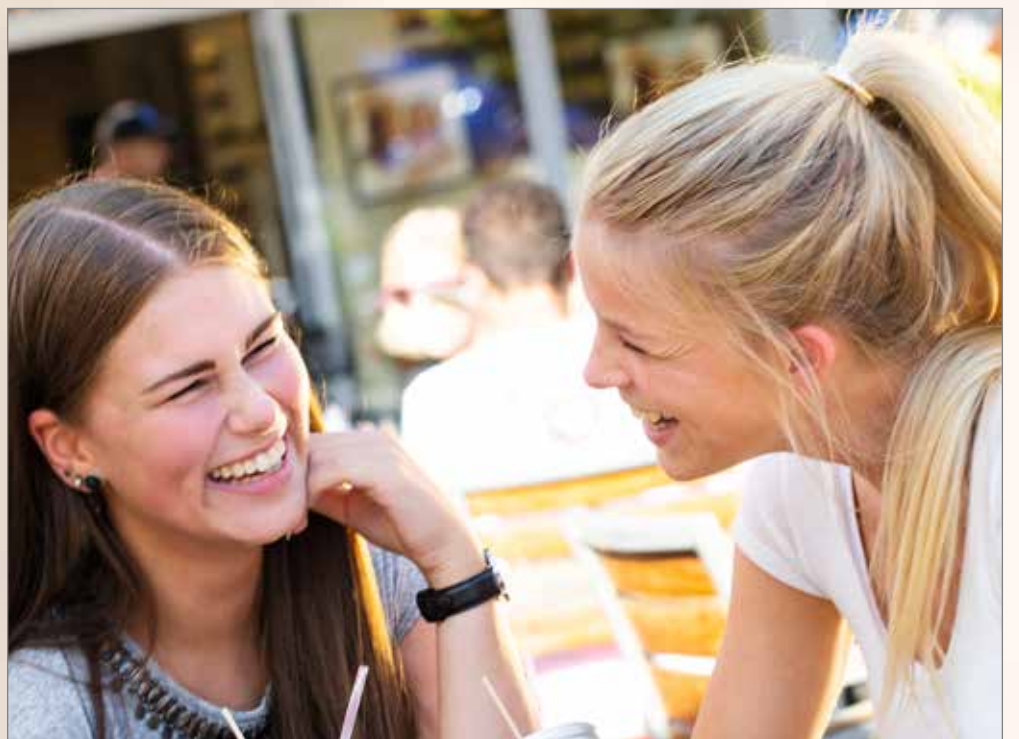
Das Amt für Schönwetterwolken rät: „Bei extremer Sonneneinstrahlung sollten Sie nach jedem Strohhalm greifen!“

Ananas-, Apfel-, Cranberry*-, Holunderblüten-, Johannisbeer*-, Kirsch*-, Lemon Squash-, Maracuja*- oder Rhabarberschorle* 0,2 l € 3,30 0,5 l € 5,95